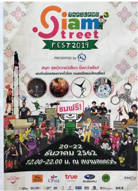
Siam Street Fest, Bancoque, Tailândia - 2019