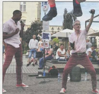
Aktorzy nawiązywali doskonały kontakt z widzami

Niecodzienni goście przez 3 dni dawali z siebie wszystko i wciągali widzów w swoje scenki i krótkie spektakle. Było wiele śmiechu. Publiczność z nieskrywanym podziwem obserwowała występy, które często były prawdziwymi show. (mac)