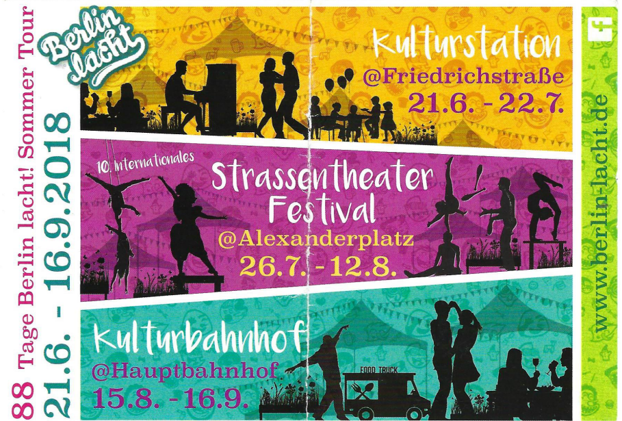
Berlin Lacht, Berlin, Alemanha - 2018