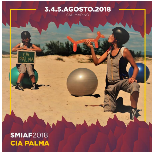
San Marino International Arts Festival - SMIAF, San Marino - 2018