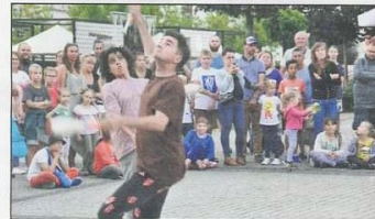
To były trzy dni bardzo dobrej zabawy

przez Krotoszyński Ośrodek Kultury. Krotoszyn był jednym z trzech przystanków tej imprezy w Polsce – po Zielonej Górze i Wrocławiu.