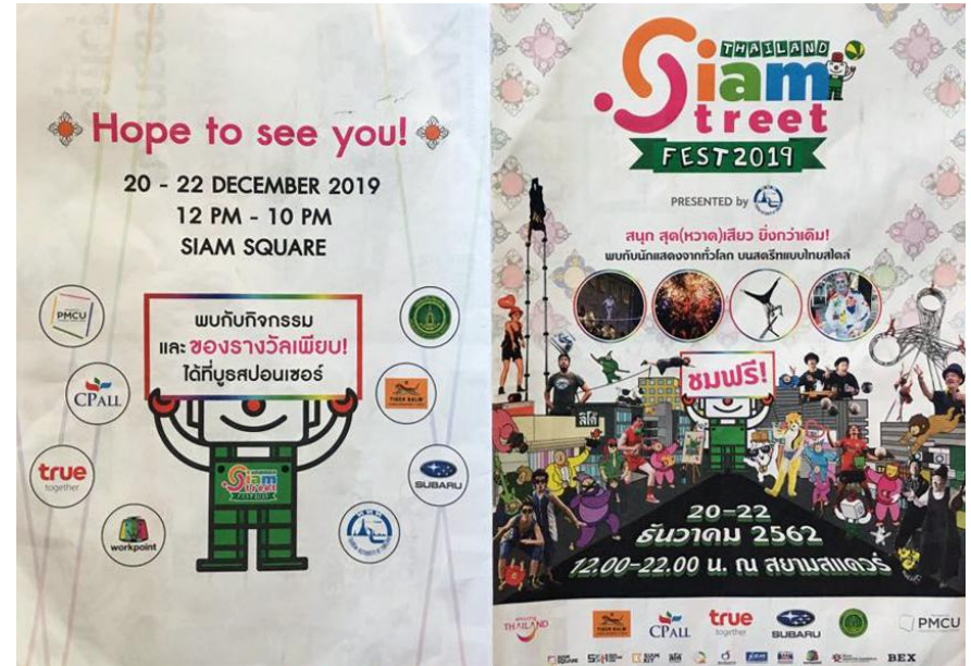
Siam Street Fest, Bancoque, Tailândia - 2019