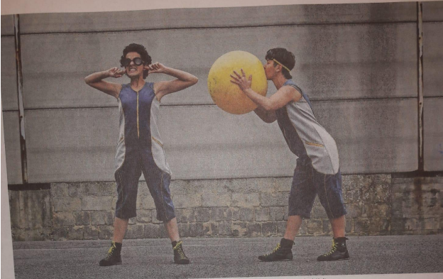
Achtung, gleich platzt er! Was man mit Bällen alles machen kann, führt die Compania Palma beim Straßenfestival-Kultur vor.