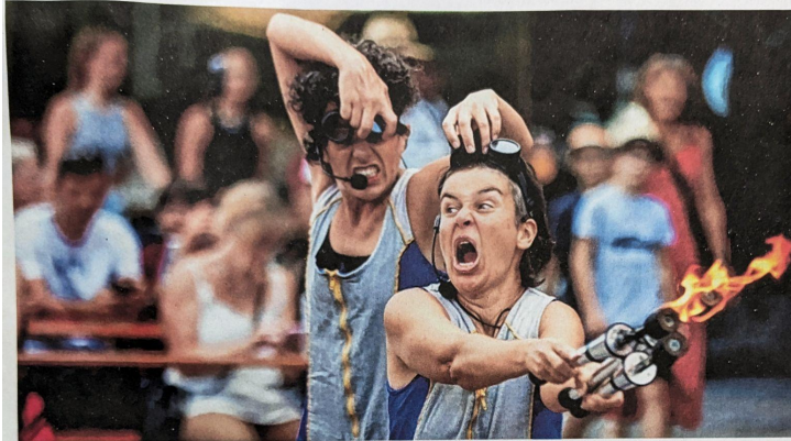
Spektakel und Spaß – das war reichlich geboten bei der diesjährigen Auflage von Kultur auf der Straße in Neu-Ulm.