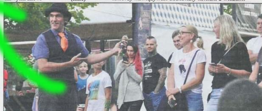
Śmiechu było co niemiara...